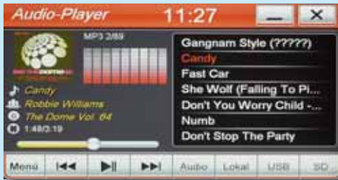
Coverdarstellung bei MP3-Wiedergabe