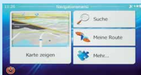
Auch hier kommt iGo zum Einsatz