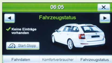
Anzeige der Fahrzeugfunktionen

Mitgeliefert wird die bewährte iGo-Primo-3D-Navissoftware mit TMC auf 8-GB-SD-Karte. Das Kartenmaterial umfasst 46 europäische Länder mit Points of Interest, 3D-Gebäudeansichten, TTS-Sprachausgabe, Warnhinweisen, über 25 System- und Ansagesprachen. Die Latest Map Guarantee erlaubt das kostenlose Herunterladen der neuesten Kartendaten bis zu 30 Tage nach Aktivierung über www.naviextras.com . Wer eine andere Navigationslösung bevorzugt, kann das ESX für 150 Euro weniger auch ohne Navi-Software erhalten. Zum sicheren und legalen Freisprechen bietet das VN830 ein integriertes Bluetooth-Modul mit Telefonbuch-Synchronisation und A2DP-Audiostreaming.